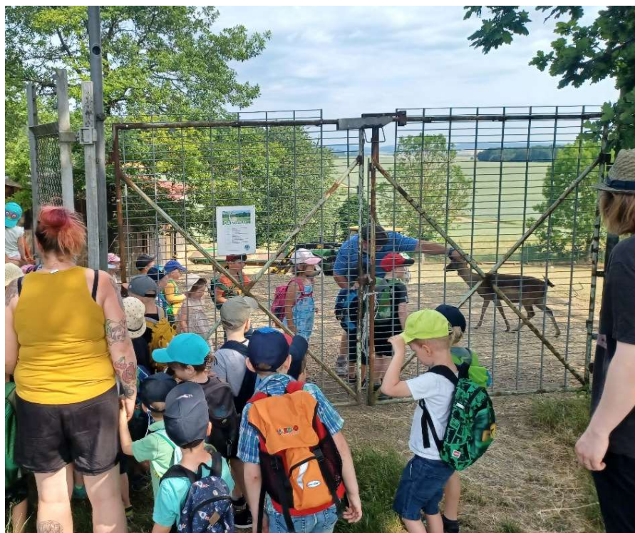
Auflösung: mitten im Geäst versteckt sich ein Rehkitz.